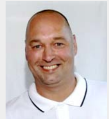
Produktspezialist IOS & Imaging DEXIS