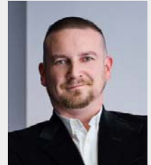
Zahntechniker, Gebietsleiter SCHEU Dental