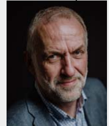
IOS Produktspezialist DEXIS